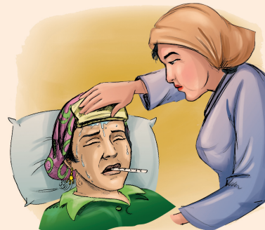
• إرتفاع في درجة الحرارة.