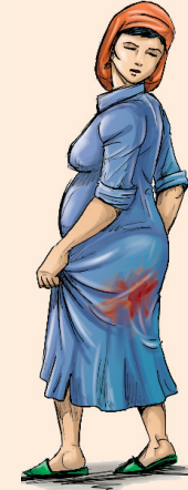
• نزول دم مهما كان قليلاً.