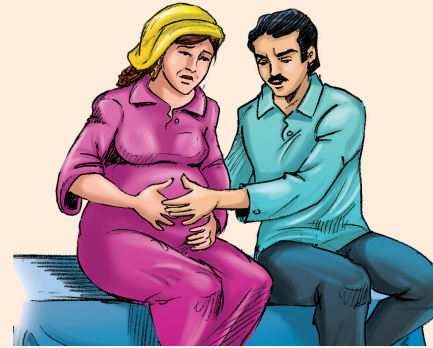
• عدم الإحساس بحركة الجنين لمدة ٢٤ ساعة.