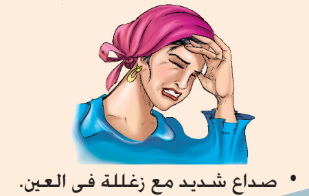
• صداع شديد مع زغللة في العين.