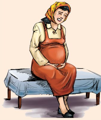
• ألم شديد بالبطن.