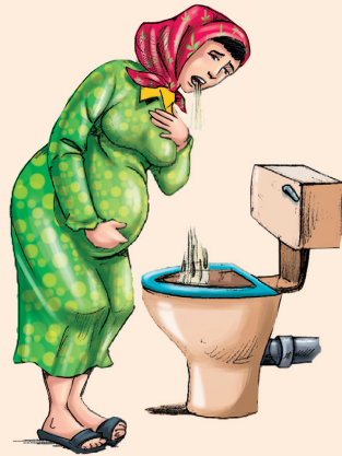
• قيء شديد مستمر.